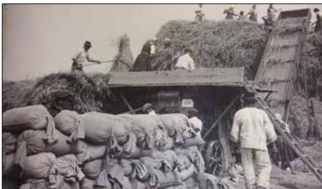
Žatevné práce v 40-tych rokoch