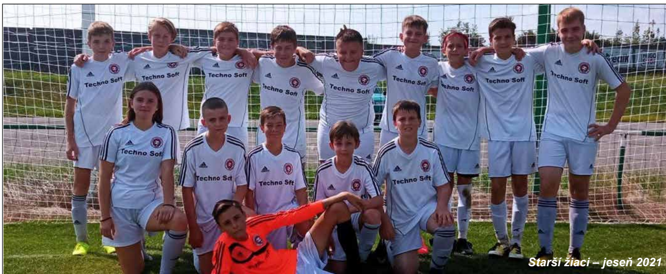
Starší žiaci – jeseň 2021