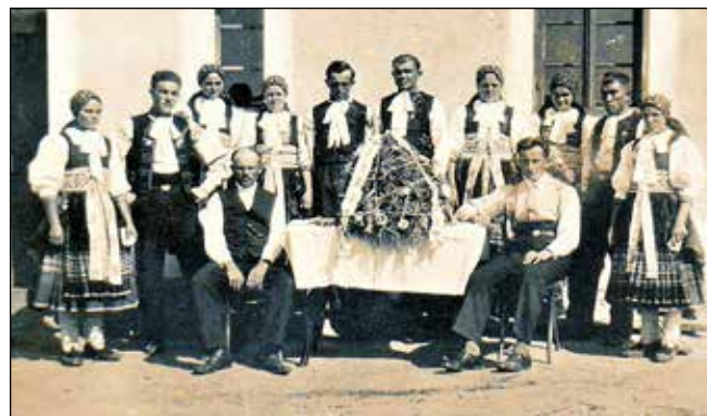
Oslavy žatvy v 30-tych rokoch v dolnom Majeri