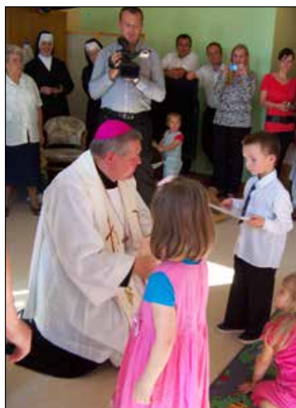
Slávnostné otvorenie CMŠ

Desať rokov slávime, veselo sa hráme, a v tej našej školičke dobre sa tu máme.