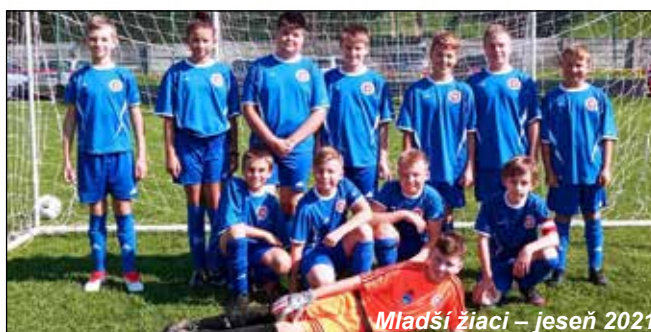
Mladší žiaci – jeseň 2021