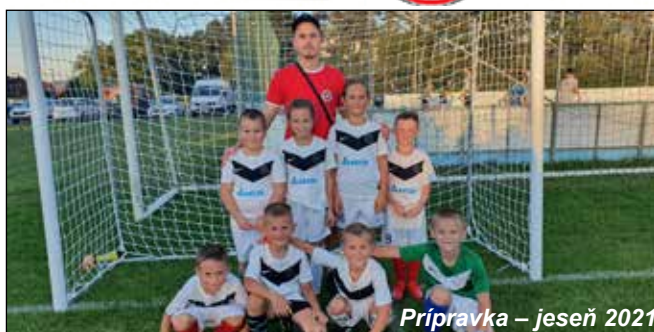
Prípravka – jeseň 2021

Jesenná časť súťažného futbalového ročníka 2021/2022 pokračuje vo všetkých prihlásených kategóriách.