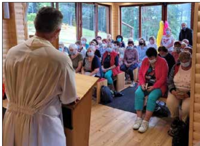
Púť do Litmanovej