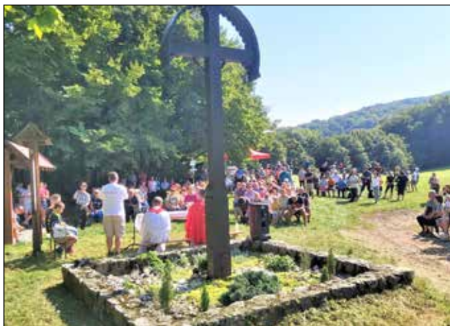
Sv. omša na Lúčkach