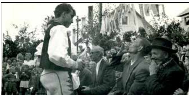
Prvé družstevné dožinky v roku 1955