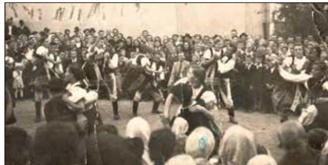
Roztancovaná mládež pri dožinkových oslavách v strede obce