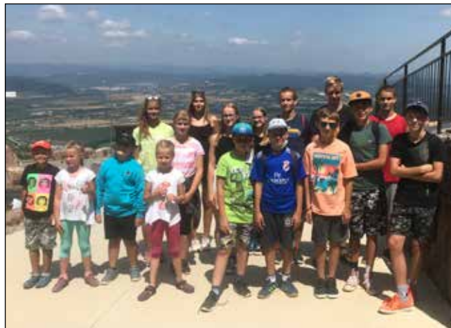
Na Butkove s deťmi