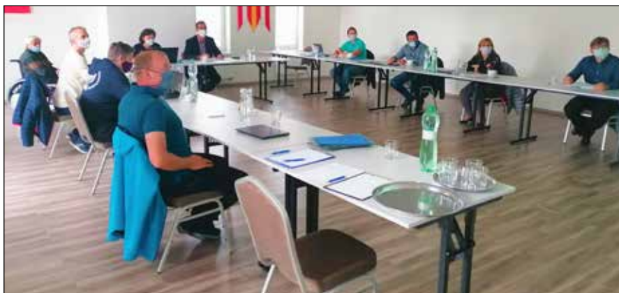
Rokovanie OcZ počas koronakrízy sa konalo vo veľkej zasedačke OcÚ

Zobralo na vedomie informáciu predsedu komisie na ochranu verejného záujmu o predložení oznámenia funkcií, zamestnaní, činností a majetkových pomerov starostu obce Soblahov k 30.4.2020 podľa príslušného zákona.