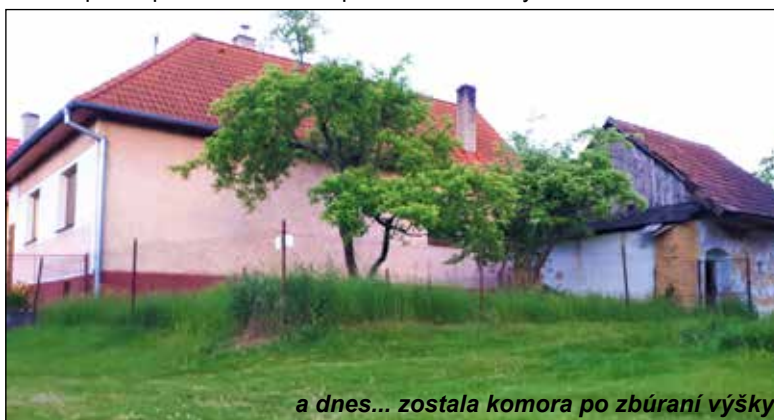
a dnes... zostala komora po zbúraní výšky