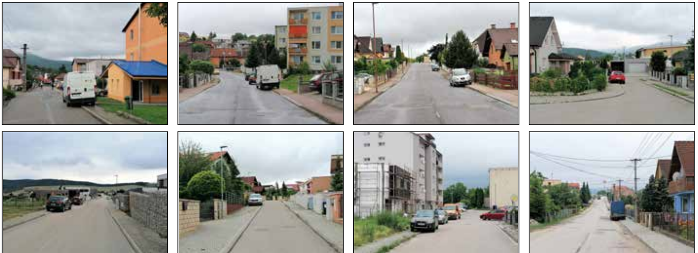
Na fotografiách vidíte parkovanie vozidiel počas pracovného dňa 29.6.2020 okolo 13:00 h. Keby sa v tomto čase pohybovala po obci polícia, mala by zarobené. Koľko odparkovaných vozidiel by bolo počas víkendu alebo vo večerných hodinách?