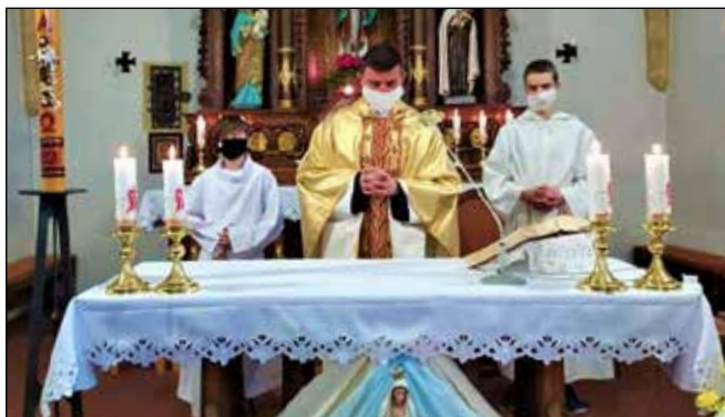
NÁVŠTEVA CHRÁMU ZA PRIJATÝCH OPATRENÍ