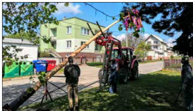
FOTOGRAFIE ZO SOBLAHOVA, KTORÉ OBLETELI SVETOVÉ MÉDIA