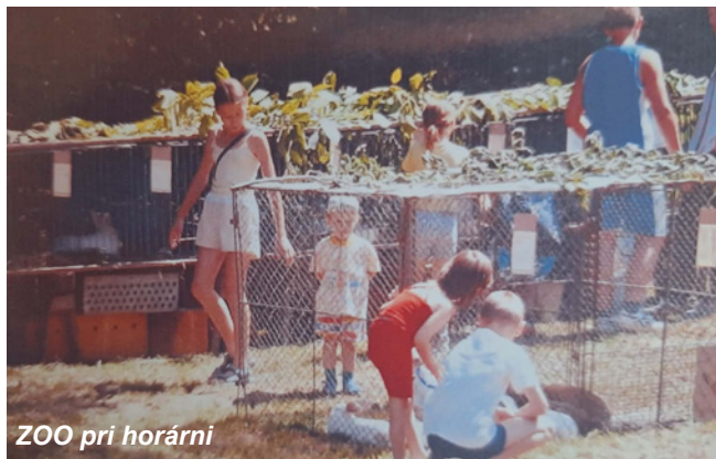
ZOO pri horárni

V roku 2001 sa Mestské kultúrne stredisko Trenčín, Správa mestských lesov Trenčín a Obecný úrad Soblahov rozhodli v júni usporiadať propagačnú výstavu v areáli horárne pod názvom „ZOO v prírode“, kde pozvali i nás, chovateľov. Táto akcia mala mimoriadny úspech nielen u detí, ale aj u ich rodičov. Radosť mali hlavne mestské deti, ktoré niektoré živé zvieratá videli po prvýkrát. Škoda, že podujatie po šiestich rokoch zaniklo, veď to bola radosť nielen pre deti, ale i našich chovateľov, ktorí ich chceli svojimi chovateľskými záľubami potešiť a sami si dokázať, aké pekné je ukázať svojho koníčka aj širokej verejnosti.