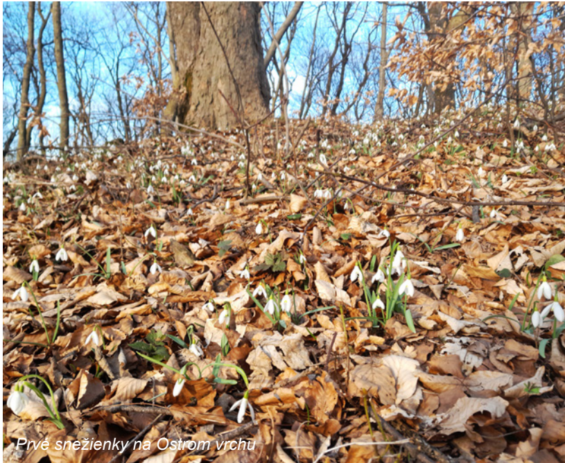
Prvé snežienky na Ostrom vrchu