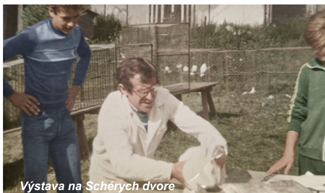
Výstava na Schérych dvore