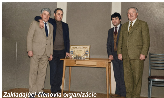
Zakladajúci členovia organizácie

Ich činnosť bola zameraná hlavne na chov hrabavej hydiny: sliepky, husi, kačice, no pribudli i králiky, ovce, ošípané. V tom období sa veľmi rozmohol chov nutrií, ktoré chovateľom odoberal podnik Branko v Nitre. Peniaze si členovia spolku zabezpečovali spoločnými brigádami na miestnom JRD, prípadne organizovaním tanečných zábav.