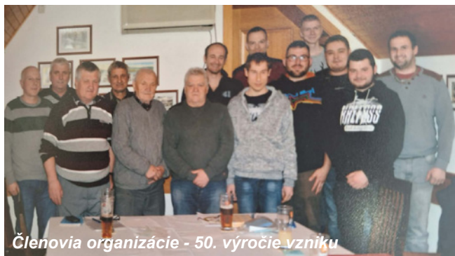
Členovia organizácie - 50. výročie vzniku

Lebo je to nielen láska k zvieratám, ale každodenná povinnosť pri ich chove. A na to už dnes nie je čas, ba ani chuť, veď v obchodoch je všetkého dostatok a hlavne bez starostí.